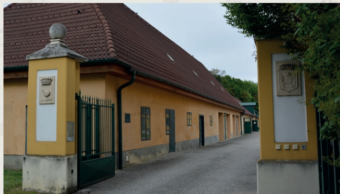
Das Einfahrtstor zur Meierei mit dem Schloissnigg-Wappen (links) und dem Marenzi-Wappen (rechts)

Am Einfahrtstor zur Meierei sind die Wappen der beiden Familien der Freiherrn von Schloissnigg und Grafen Marenzi angebracht.