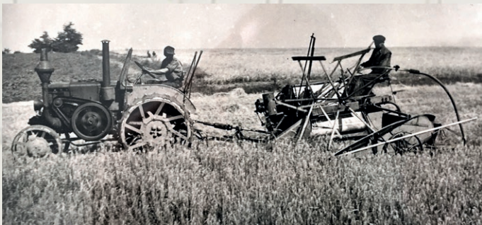
Feldarbeiter des Guthofs Marenzi bei der Ernte im Jahr 1948

In den Jahren des Nationalsozialismus war der Meierhof Sperrgebiet und es wurden (möglicher Weise) in der Gramatneusiedler-Straße 124 als auch im Meierhof (damals Ebergassing 124) ungarisch-jüdische Zwangsarbeiter für die Feldarbeit (Bild oben) als auch für Arbeiten in der Fabrik interniert. Eine endgültige geschichtliche Aufarbeitung dieser Zeit ist noch ausständig.