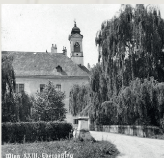
Wien, XXIII., Ebergassing Schloss Ebergassing, um 1945

Nach dem Ende der russischen Besatzung kehrte die Familie Schloissnigg/Marenzi wieder nach Ebergassing zurück und übernahm ihre Besitzungen.