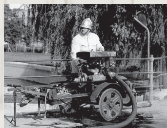
Eine Motorspritze aus dem Jahr 1940

Unter Kommandant Wilhelm ARBINGER erhielt die Feuerwehr 1937 eine Motorspritze von der Firma Rosenbauer, die eine Wasserversorgung mittels Treibstoffes (Benzin-Gemisch) ermöglichte. Im Jahre 1972 kaufte die Feuerwehr ein Tanklöschfahrzeug Opel Blitz mit 1000 Liter Wassertank an. Dies konnte 1989 durch ein neues Tanklöschfahrzeug TLFA 4000 mit 4000 Liter Wasser und 200 Liter Schaum ersetzt werden.