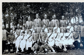
Die Freiwillige Feuerwehr Ebergassing-Ort in den Jahren 1921 (links) und 1930 (rechts).