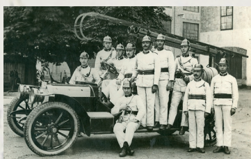
Betriebsfeuerwehr Eybl um 1930.

Im Jahre 1905 waren es bereits 51 Mitglieder. Der Umbau eines alten Personenautos in eine Autospritze wurde am 6.12.1924 erwirkt und im Betrieb durchgeführt. Am 27. August 1925 fand die erste Übung mit der Autospritze statt. Der Umbau betrug damals 7.000 Schilling. Am 6. September 1925 wurde die Wehr inspiziert und die Autospritze in den Dienst gestellt. Im Laufe der Jahre wurden mit der Autospritze mehrere auswärtige Einsätze gefahren.