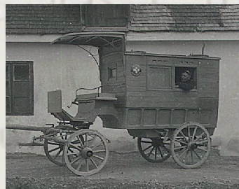
Das Rettungswesen um 1908

Im Jahr 1908 wurde ein Rettungswagen aus Wien geholt. Die Feuerwehr fuhr zu dieser Zeit auch Rettungseinsätze unter Johann LIEBEL. Die Pferde konnten nun durch selbst fahrende Arbeitsmaschinen ersetzt werden und auch Traktoren, welche von den Landwirten gestellt wurden, kamen zum Einsatz.