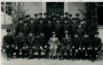
Betriebsfeuerwehr Philipp Haas und Söhne um 1930.