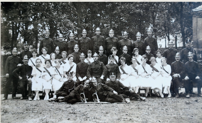
Fabriksfeuerwehr Franzensthal 1921

Als erste Freiwillige Feuerwehr wurde die Feuerwehr der Papierfabrik Franzensthal im Jahre 1881 in Ebergassing gegründet.